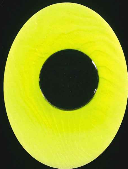
3. | Revelation —KOMOREBI— 18.7×9.0cm